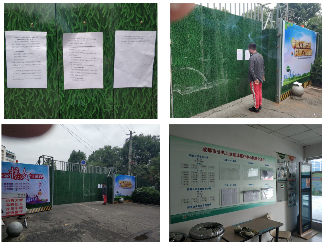
图 6 张贴在成都市公共卫生临床医疗中心三期建设项目施工工地公示信息

疗中心院务公开栏和施工营地大门口位于项目建设地，张贴的信息对就诊的人员吸引力大，浏览和关注群众多，周边群众能更好的接收到项目公示的信息。选择此处张贴有利于公示信息的传播，方便周边群众及时获取信息。选择在项目地张贴公示，更好的关注到受项目直接影响和间接影响的个人、单位，鼓励和尊重他们提出意见和建议。