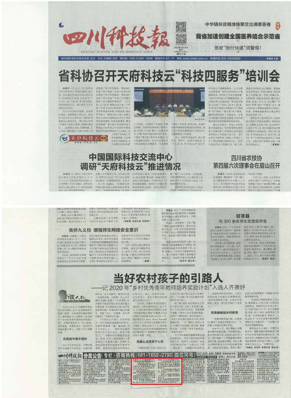
图3 报纸公示照片（2020年9月18日）