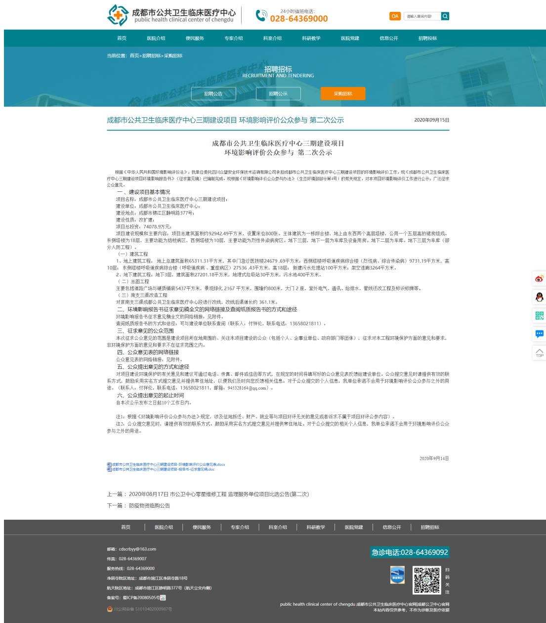
图 2 项目环评征求意见稿网络公示截图