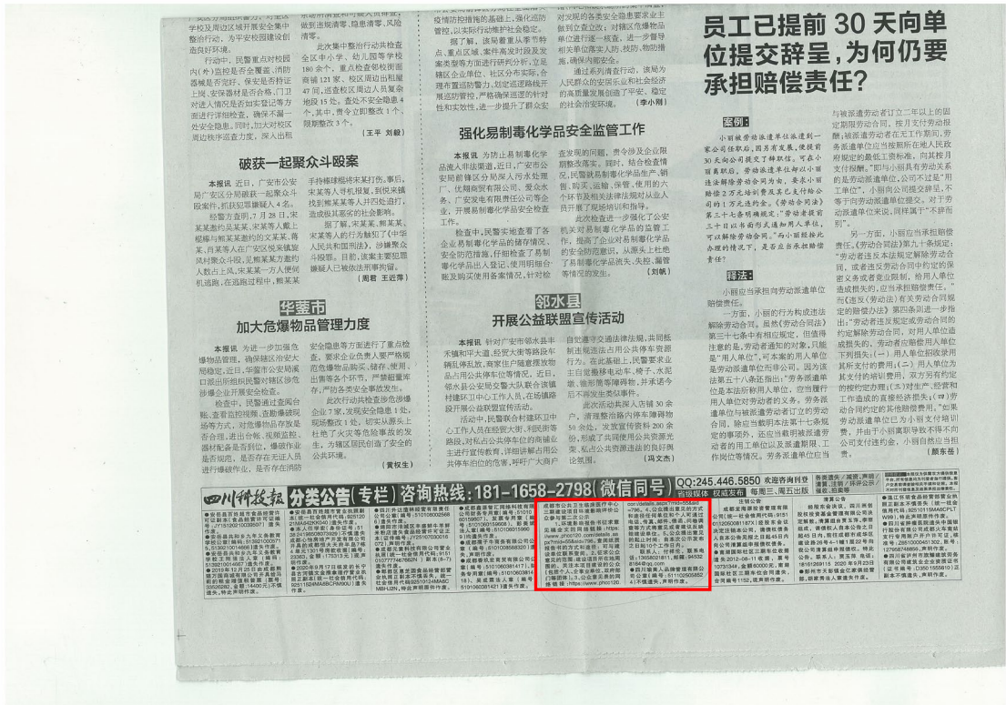
图3 报纸公示照片(2020年9月23日)